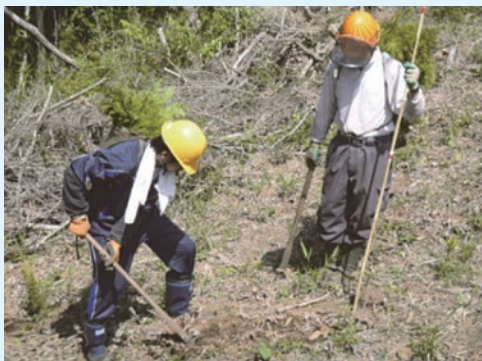
植林作業を体験する高校生