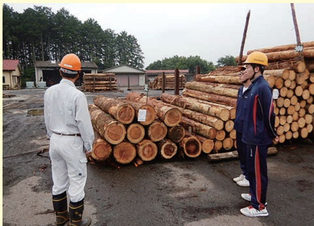
大田原共販所を視察