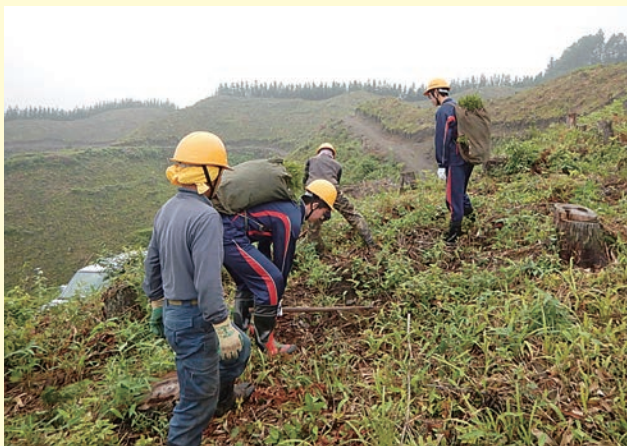
那珂川町大山田地内で植林作業を体験