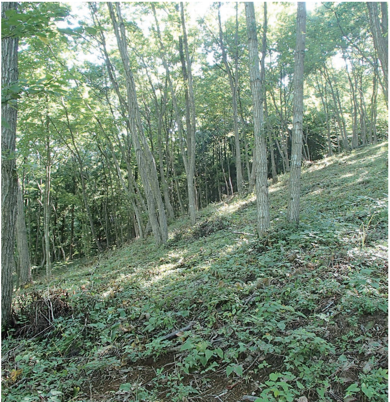
那珂川町小砂地内の雑木林